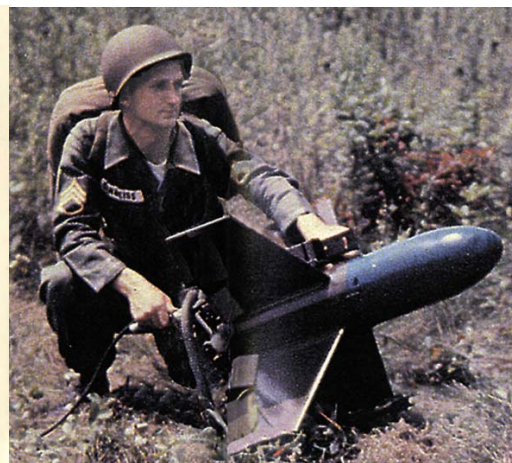
Arsenal 5202/SS 10