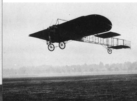
Voisin « Henri Farman n° 1 bis» : Bouy-Reims le 30.10.08.