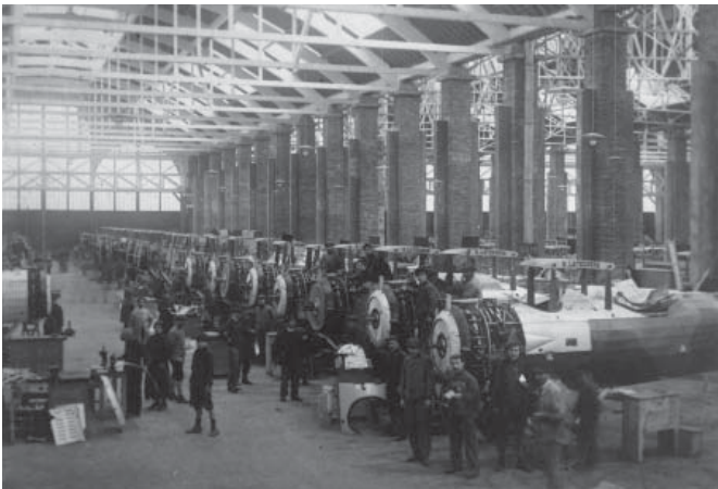
Les chaînes de montage Salmson dans les grandes halles de Montaudran - 1917