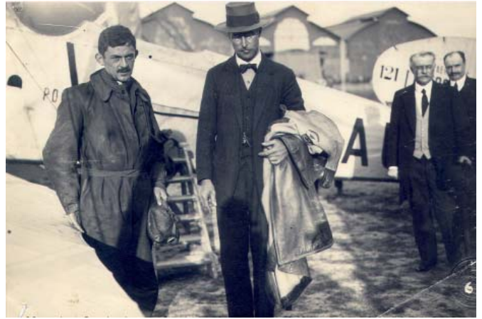
Arrivée du Roi des Belges Albert 1 er de Casablanca avec le pilote Dombray - Montaudran 1921