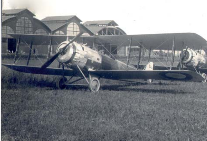
Les avions devant les halles de montage construites en 1917, et aujourd'hui protégées au titre des Monuments Historiques.