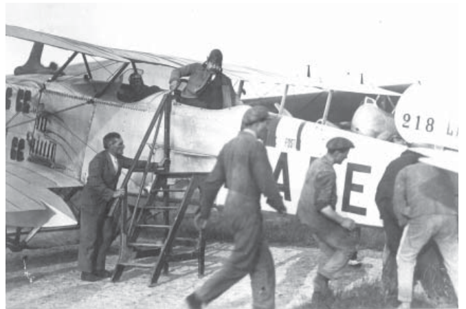
Arrivée du Ministre et scientifique Paul Painlevé à Montaudran, avec le courrier.