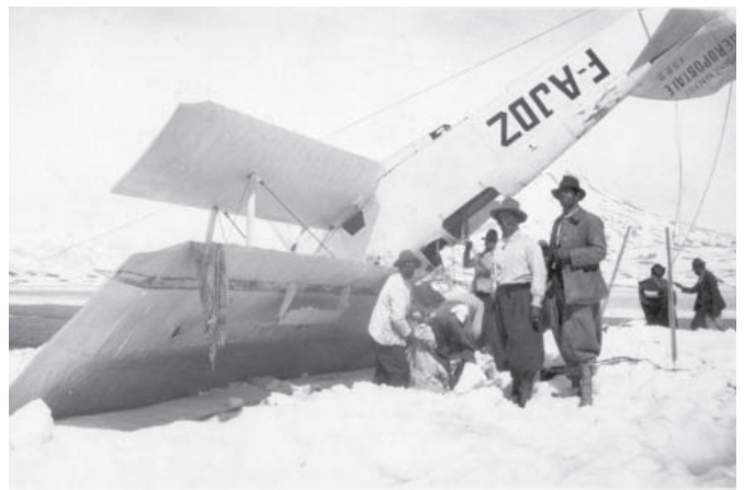
L'avion de Guillaumet accidenté dans la cordillère des Andes, à 3500 mètres d'altitude. Il marchera seul durant 5 jours avant d'être recueilli vivant par des bergers.