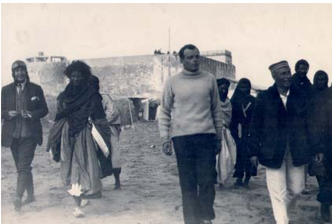
Antoine de Saint-Exupéry, chef d'escale à Cap Juby / Tarfaya. Dix huit mois passés en plein Sahara.