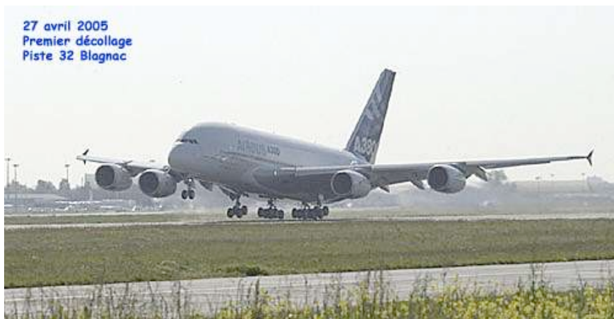
27 avril 2005 Premier décollage Piste 32 Blagnac

La certification de l'A380, le 12 décembre 2006, a clos une période de vingt mois d'essais pendant laquelle quatre prototypes ont été testés dans les pires conditions que l'on puisse imaginer : vibrations en plein vol, atterrissage sur piste inondée, décollage en altitude, tests grand froid, etc.